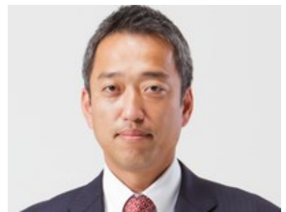
高知県 佐川町 町長 堀見 和道 氏

高知県佐川町生まれ。東京大学を卒業後、新日本製 鐵株式会社ほかを経て、2000年に株式会社堀見総合 研究所設立。2013年佐川町にUターンし町長に就任。