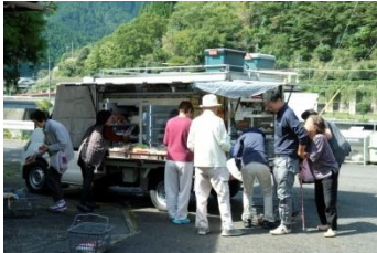
一般社団法人かわかみらいふ