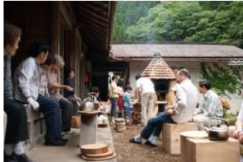
地域おこし協力隊の活動