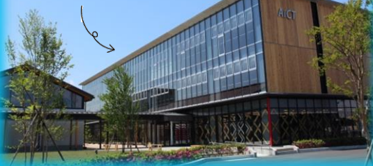
会津発のイノベーション創出拠点 「スマートシティAiCT」