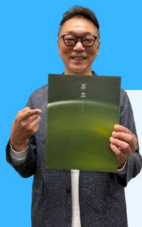
審査委員 お笑いコンビ パッキンマックン マックン氏