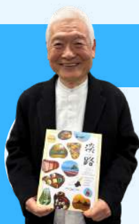
審査委員長 イラストレーター 南 伸坊氏