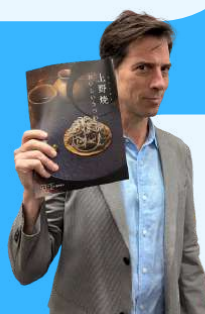
審査委員 お笑いコンビ パッキンマックン パッキン氏