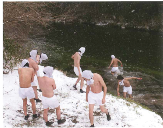
「水かけまつり」前に川で身を清める