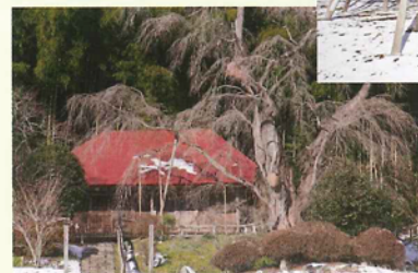
雪村庵（郡山市・JR三春駅から西へ1キロ）