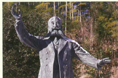
自由民権運動で活躍した河野広中の銅像 （三春町役場近く）