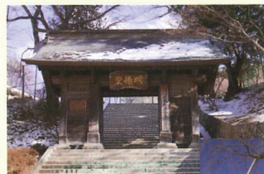
藩講所表門（明德門）