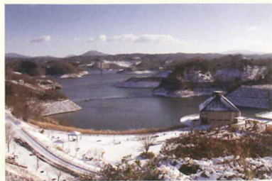
三春ダム（さくら湖）