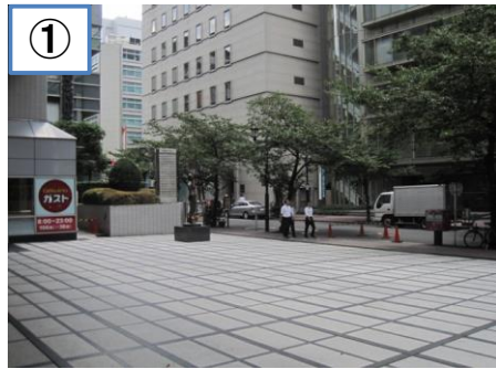
【参考】 日本橋プラザ南広場平面図（写真付）