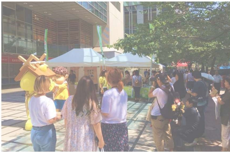
✿ ゆるキャラと撮影会